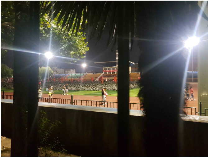
사 진 첨 부