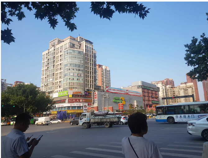
사 진 첨 부

이 곳은 화륜완지아인데, 학교 북분으로 나가서 10분 정도 걸어가면 있습니다. 이 곳에서 생필 품을 사시면 됩니다.