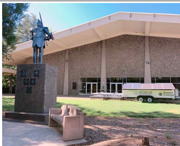
카페테리아 앞 전경입니다.