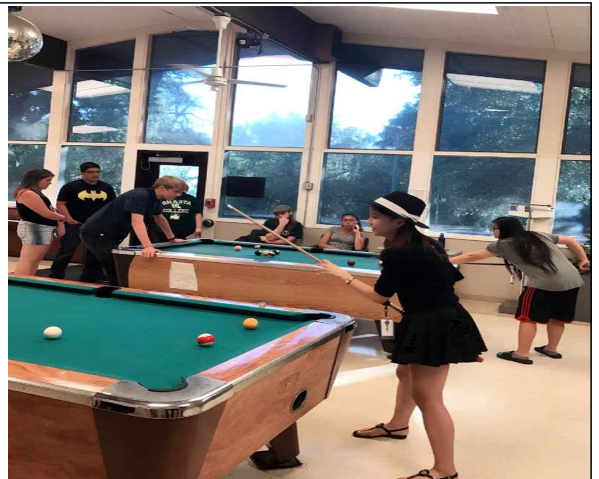
캠퍼스 내에선 주로 포켓볼을 치거나 수영을 하며 시간을 보냈습니다.