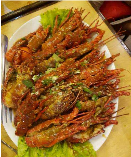
crap and valley 해산물 메뉴