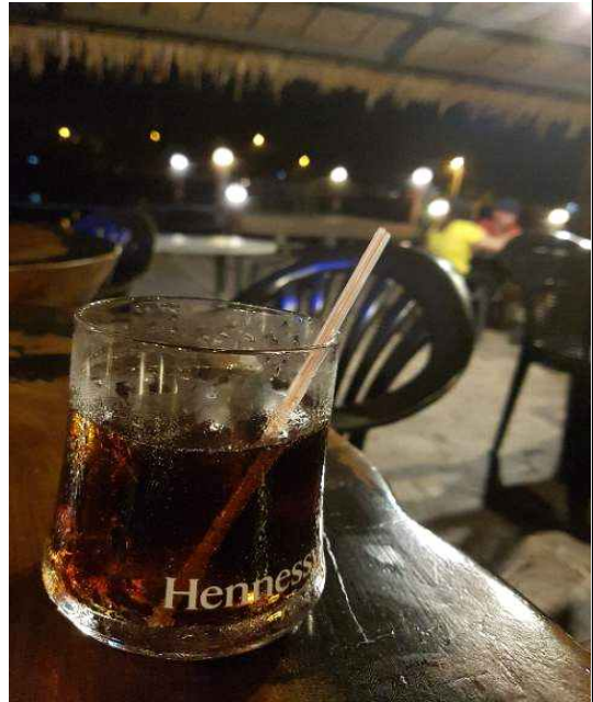
매직 라군 칵테일 바 칵테일 메뉴