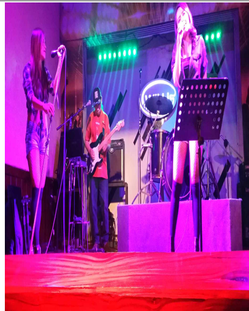
라이브 공연 중인 바