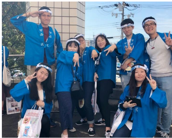
마쓰리 체험 단체사진