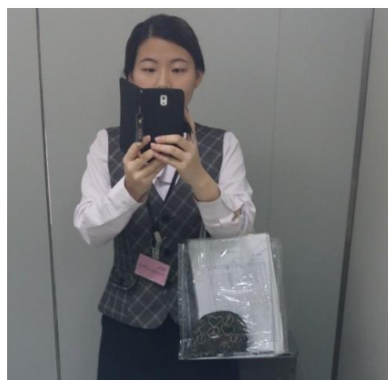
간사이 국제공항 면세점 유니폼