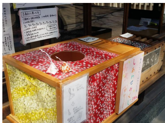
신사 오미쿠지 박스