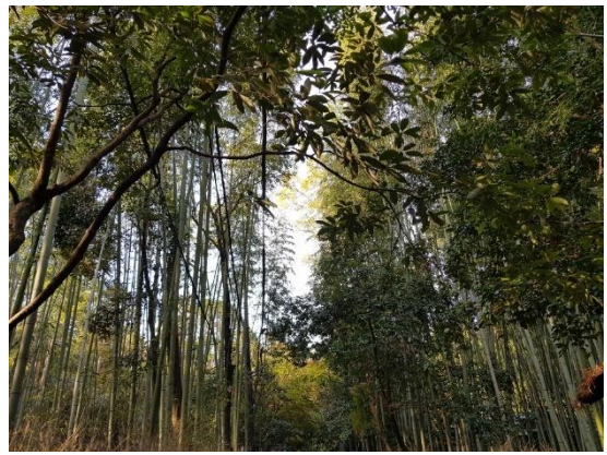
교토 아라시야마 (개인 여행)