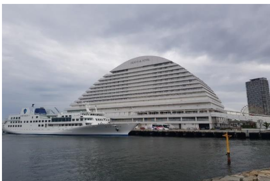
유학생 교류회 (학교 지원 프로그램)