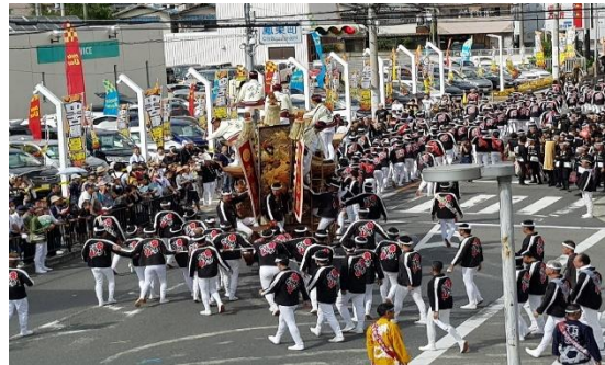
단지리 마츠리 (학교 지원 프로그램)