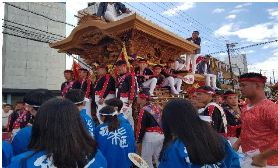
단지리 마츠리 (학교 지원 프로그램)