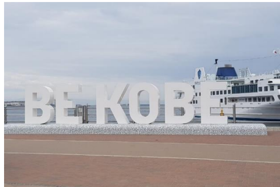
유학생 교류회 (학교 지원 프로그램)