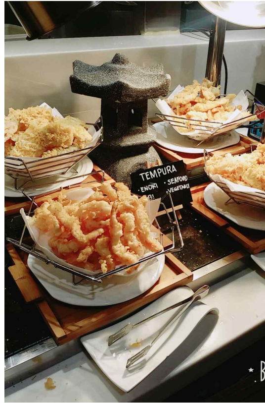
SM NORTH에 위치한 바이킹(뷔페)