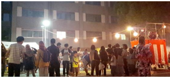
학교 여름 축제