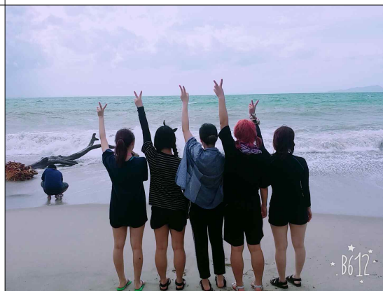
민도르 섬 투어