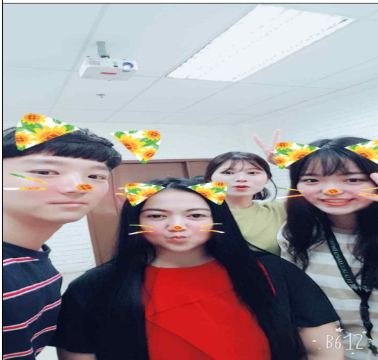
대그룹 마지막 날 선생님과 찍은 사진