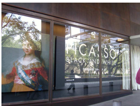
휴스턴 미술관 피카소전