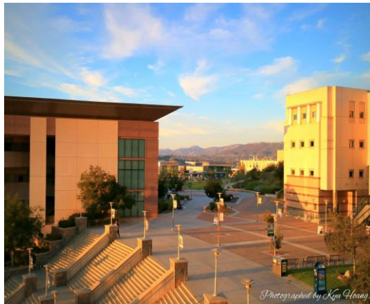
CSUSM 캠퍼스 풍경