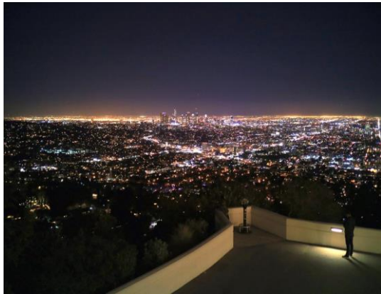
L.A. 그리피스 천문대