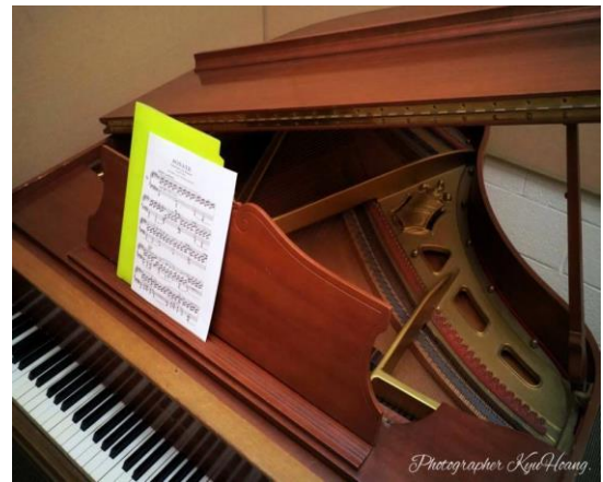
CSUSM 피아노 연습실