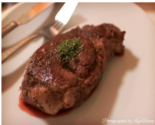
기숙사(QUAD)에서 요리한 음식