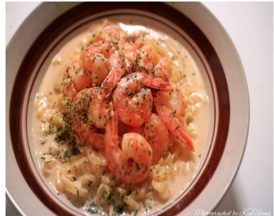
기숙사(QUAD)에서 요리한 음식