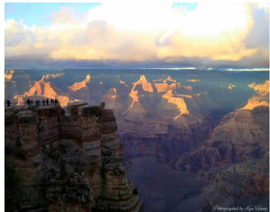
그랜드 캐년 여행