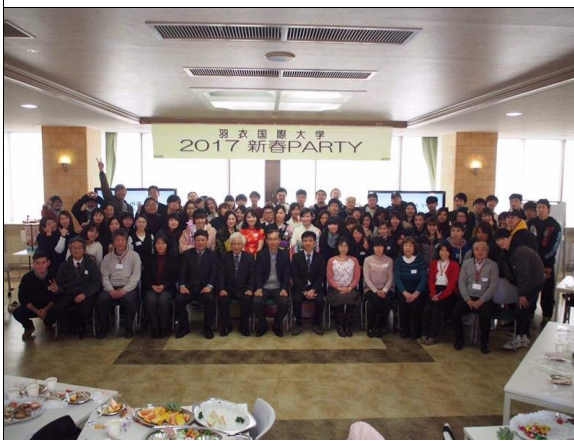
학교행사에서 사회 봤을 때