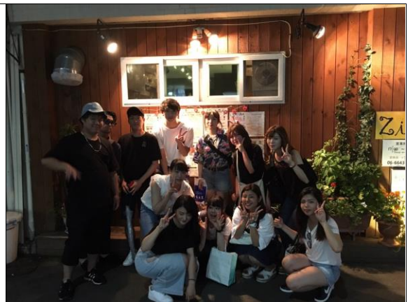
한국어 서클 친구들과 송별회