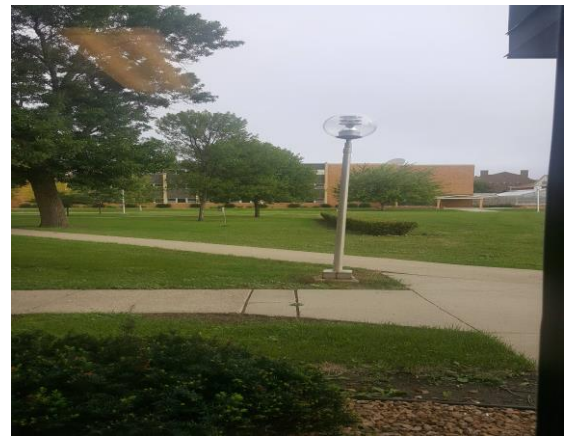
도착 후 맥웰시 기숙사에서 찍은 바깥 풍경