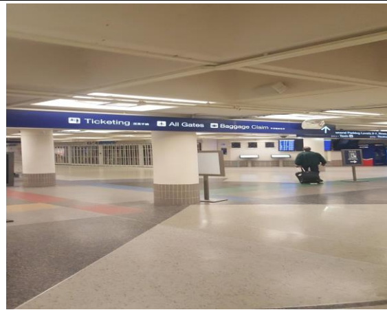
미네아폴리스 공항(미네아폴리스에서 에버딘으로 가기 전)