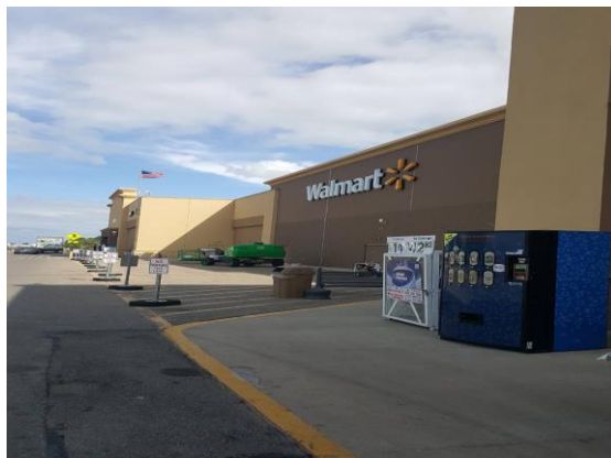
에버딘에 있는 월마트