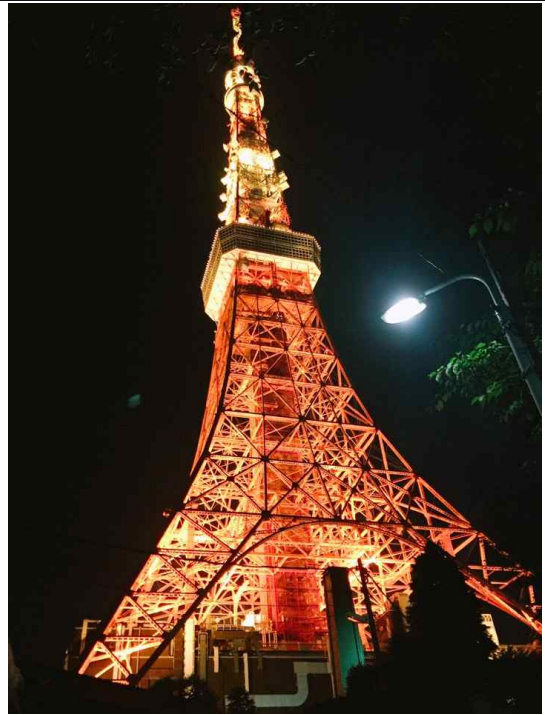
귀국 전 도쿄여행