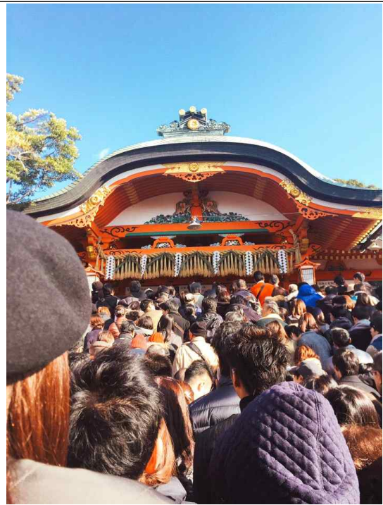
2017년 1월 1일 후시미이나리 신사