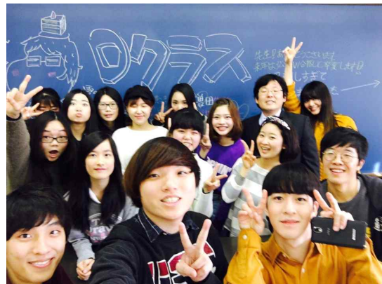
같은 반 유학생 친구들과 함께