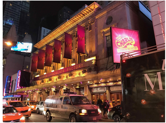
방학 때 뉴욕에서 관람했던 뮤지컬