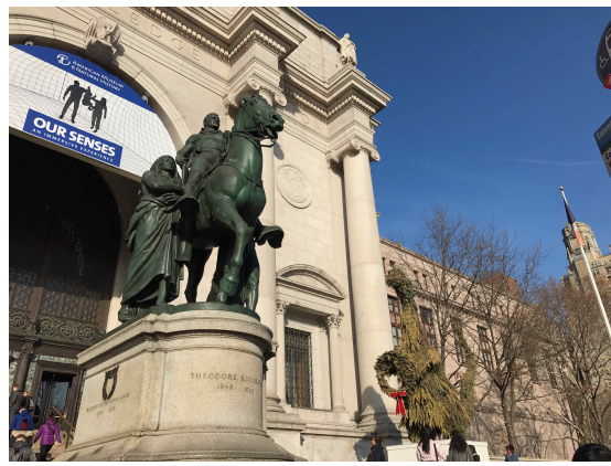
방학 때 갔던 뉴욕의 자연사 박물관