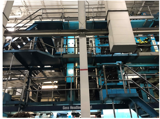
수업에서 방문했던 신문사 Star Tribune