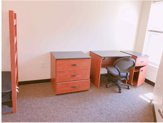
기숙사 방 구조