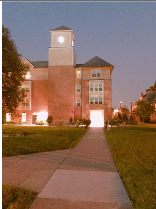
Holst Hall의 모습