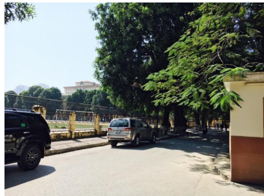
기숙사 앞에서 본 학교 풍경