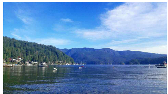
North Vancouver의 Deep Cove