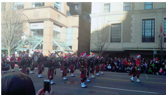
Downtown에서 진행한 Christmas parade