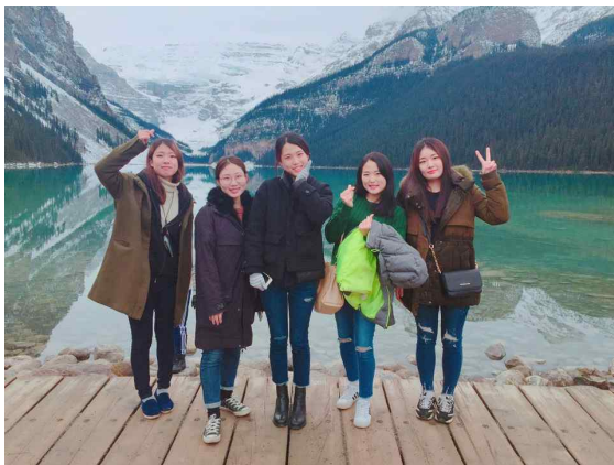
Rockey mountain 여행 중 louise lake