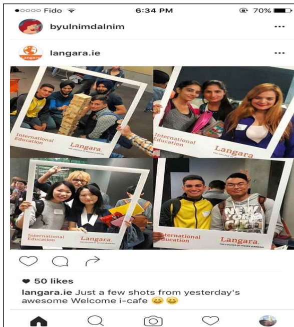
학교 프로그램인 i-cafe 참여