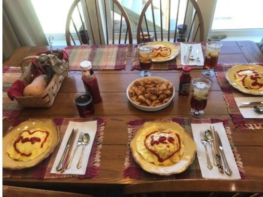
친구와 함께 만든 저녁 식사