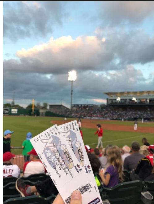
야구 경기 관람