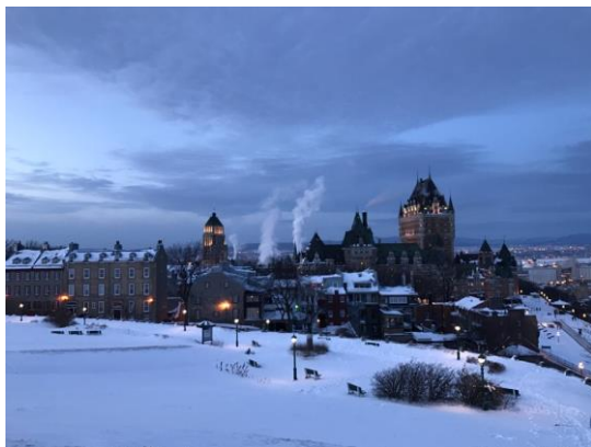
겨울방학 캐나다 여행