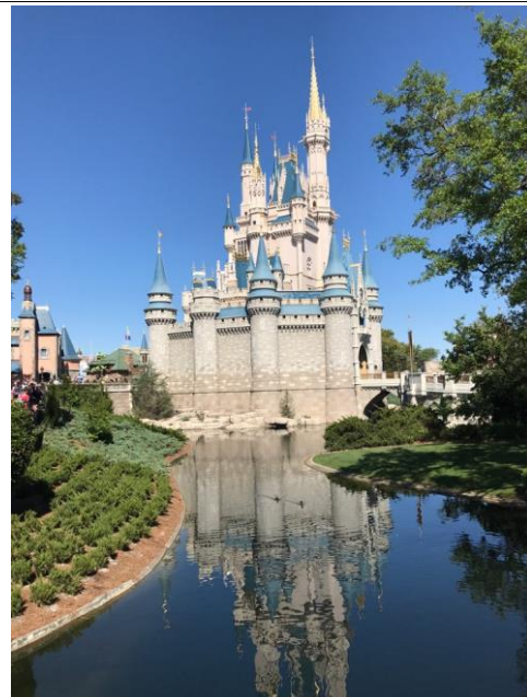
친구들과 마이애미 여행