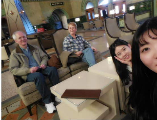
호스트가족과 세인트루이스 여행