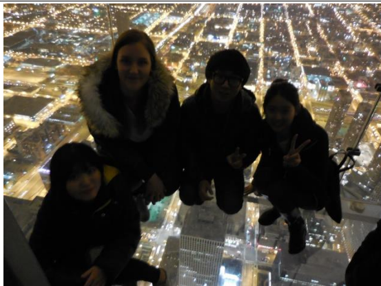
친구들과 시카고 여행