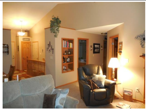
호스트 가족네 방문