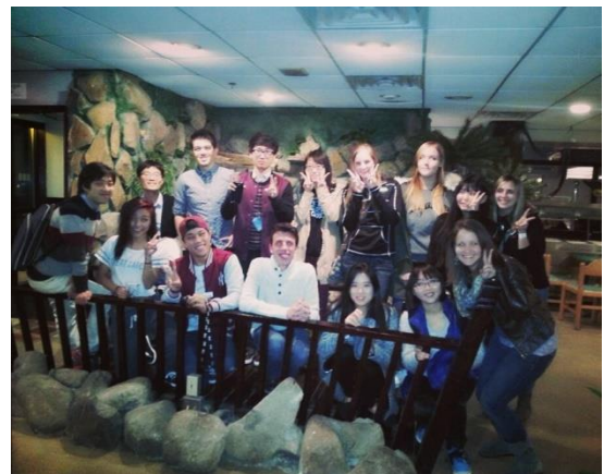
외국친구들과 한국식당 방문