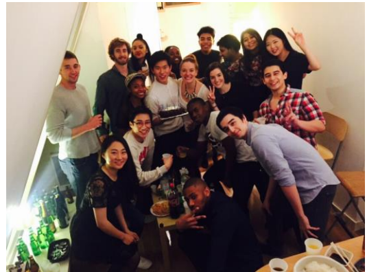
친구 생일을 맞아 집에서 한식파티