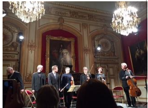
나폴레옹이 묻혀있는 영발리드에서 감상하는 현악 5중주 (뒤에는 루이14세 초상화)