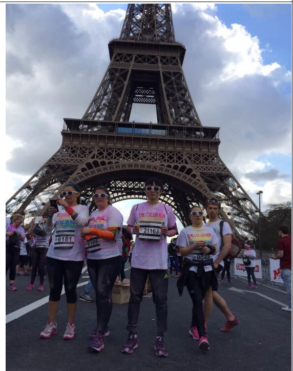
Color Run in Paris