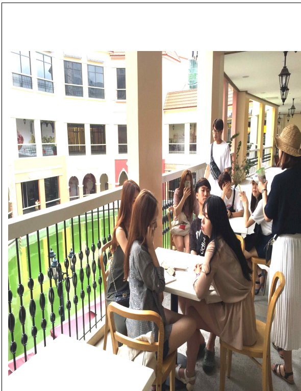
녹초가 된 빅그룹 친구들