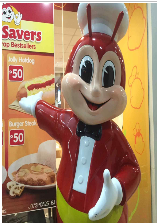
필리핀 마스코트 졸리비~~