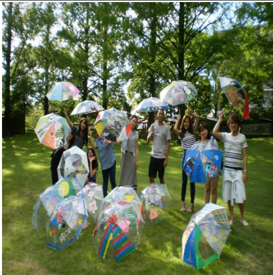
파라솔에 그림 그리기 행사