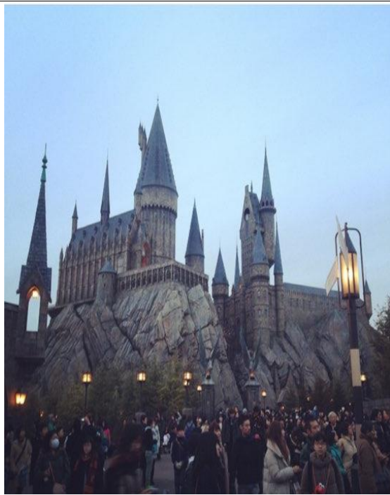
USJ의 해리포터 성