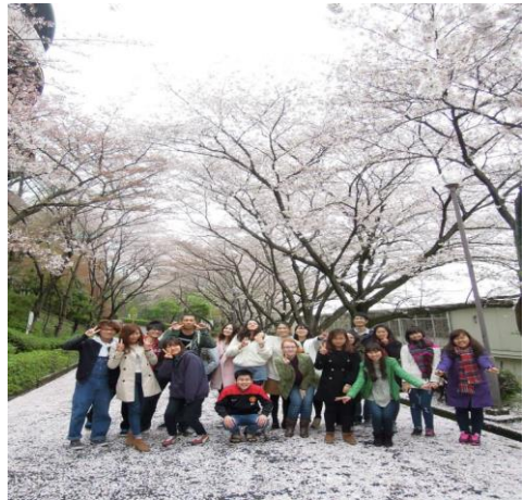
히라카타 캠퍼스 하나미