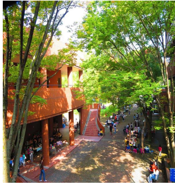
히라카타 캠퍼스 풍경