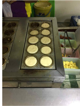
교내 카페테리아에서 파는 계란 빵