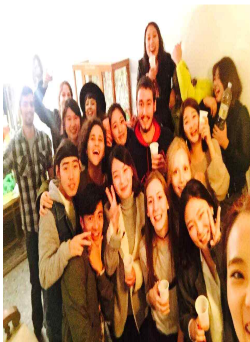
한국인 생일 파티