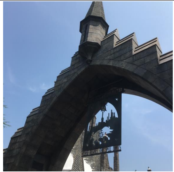
아르바이트 했던 유니버설 스튜디오의 해리포터존