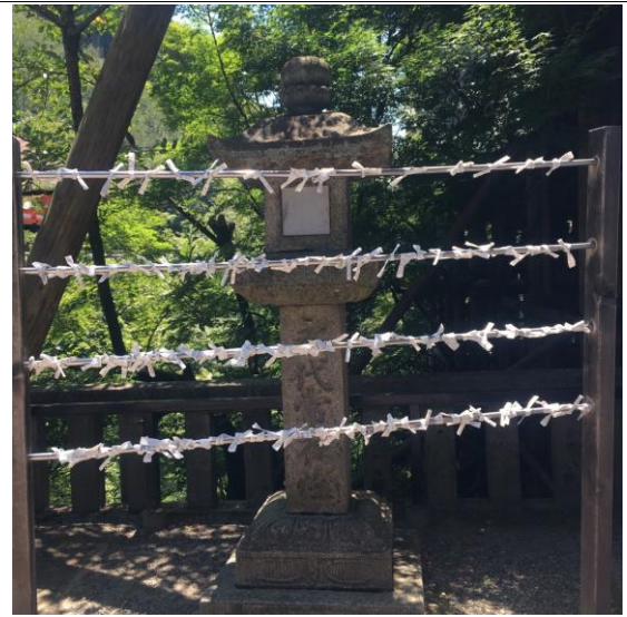
신사에서 오미쿠지를 보고 난 후 묶어 놓은 것