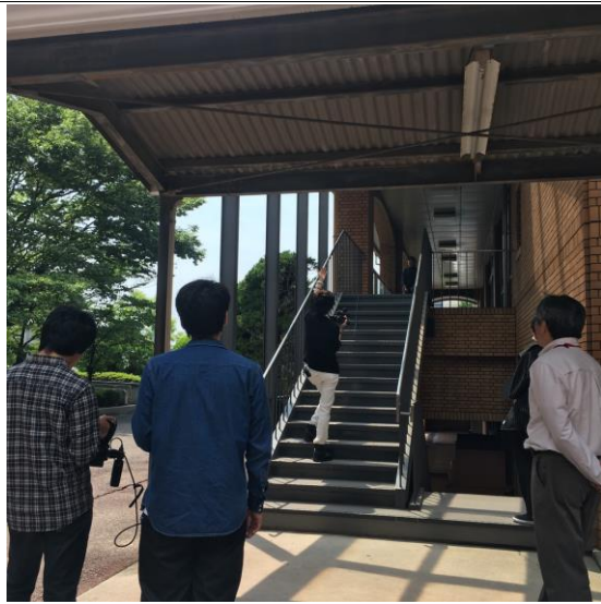
수업 중 리허설 촬영