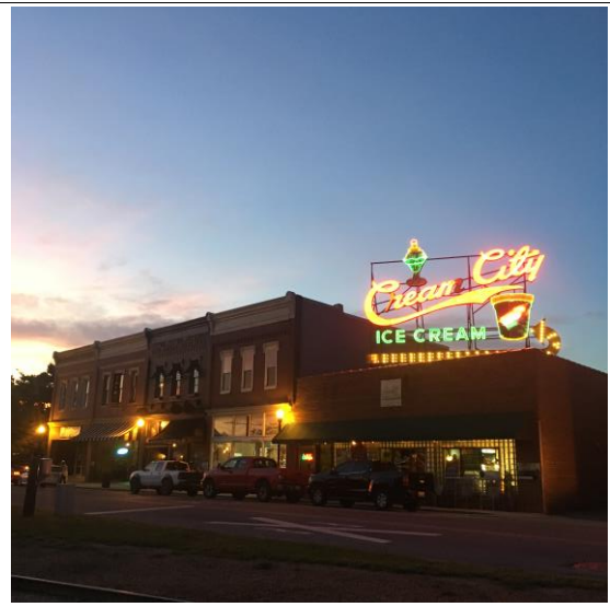
크림시티(여기 아이스크림 진짜 맛있어요)