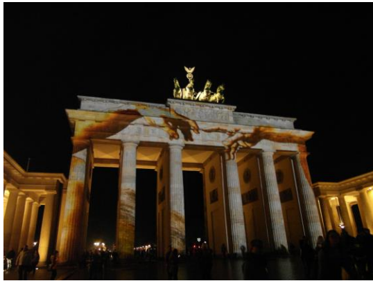
베를린 빛 축제