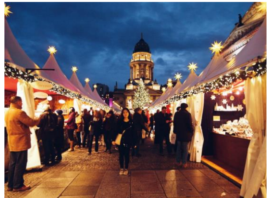
베를린 크리스마스 마켓