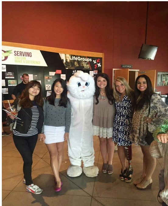
부활절 오클라호마에 있는 친구 집