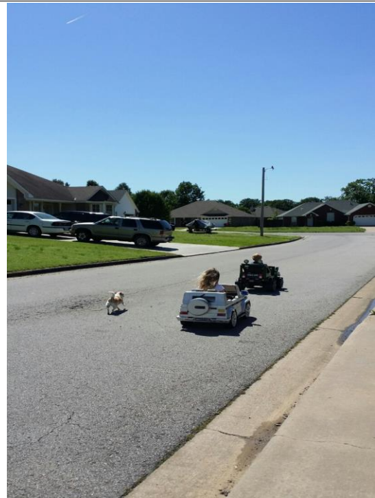
친구와 친구 친척동생 babysitting