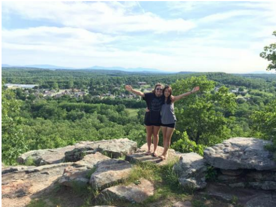
친구와 여행 중 찍은 사진