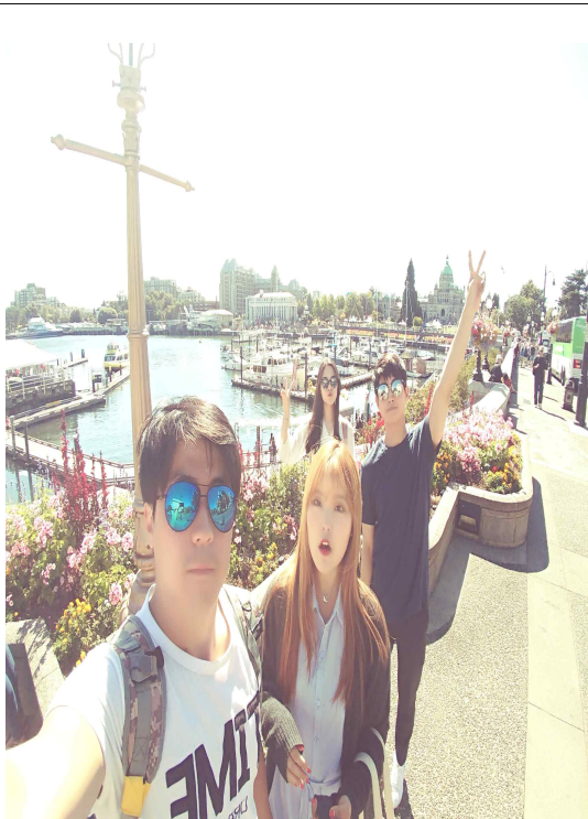
Victoria island에서 찍은사진