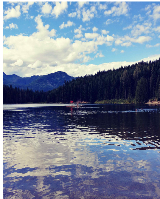
Whistler에 있던 lone lake