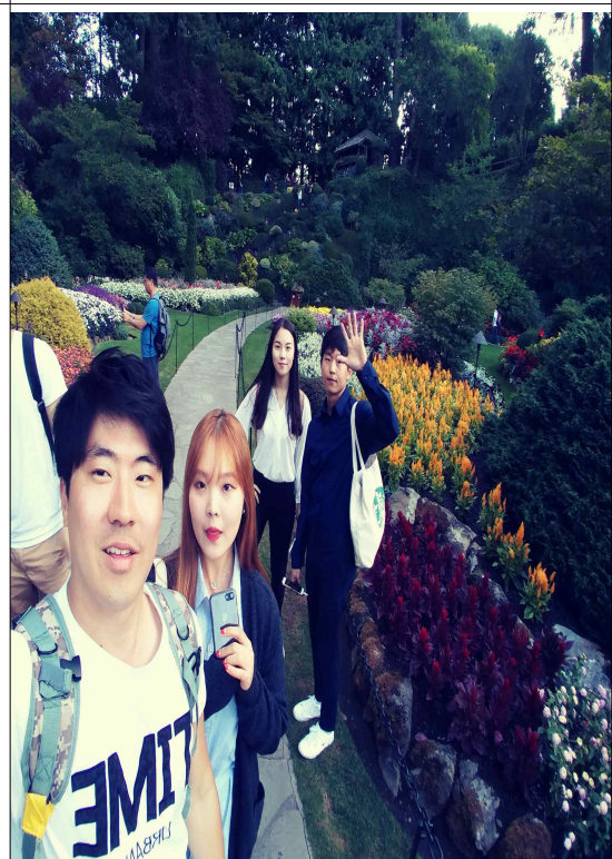
Victoria island에서 찍은사진