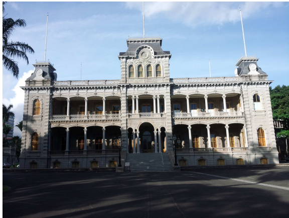
학교 근처 이올라니 궁전