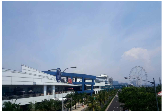
SM Mall Of Asia