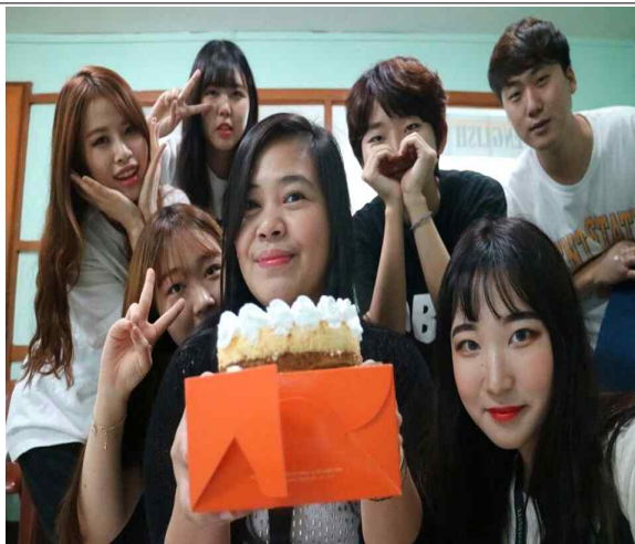
Chona 선생님 생일 준비