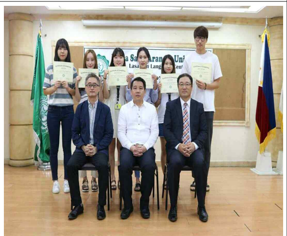
라살아라네타 대학 졸업식