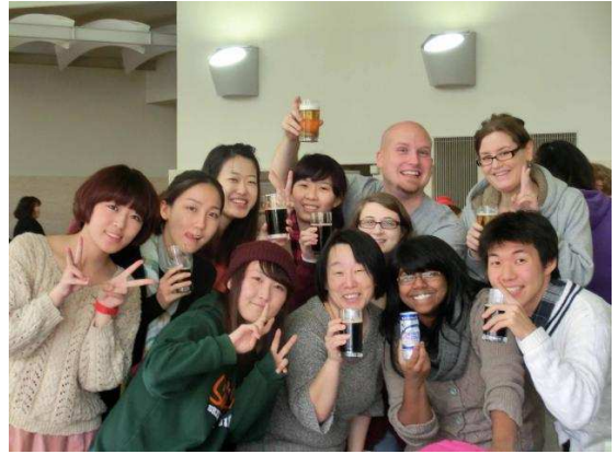
아사히 맥주공장 견학