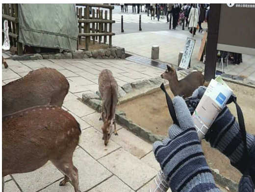
나라 (奈良) 공원