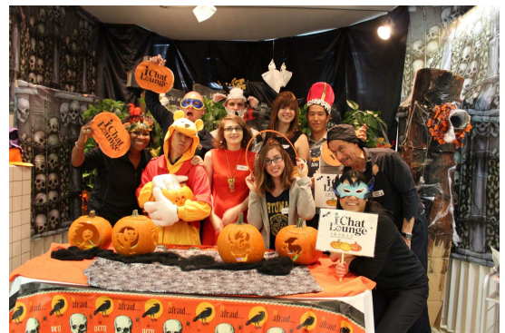
할로윈 파티(학교 주체)