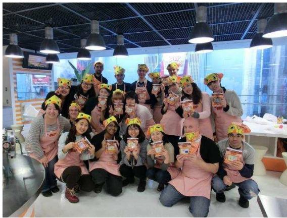
치킨 라면 공장 견학 및 직접 제작