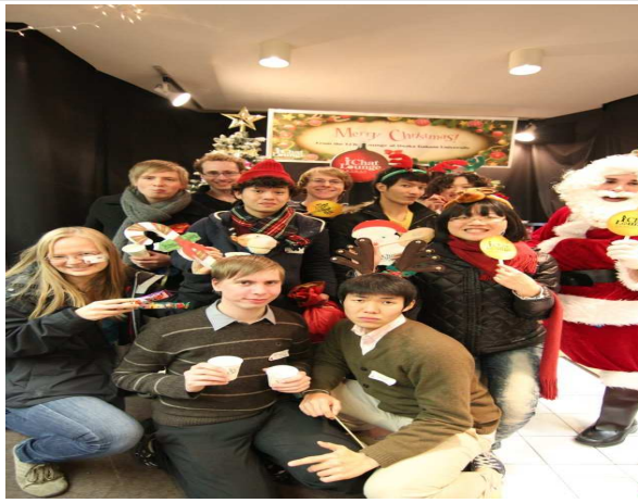
크리스마스 파티(학교 주체)