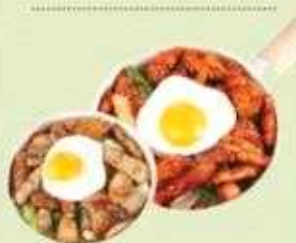
[직화삼겹살] [직화불삼겹살덮밥] 5,900원