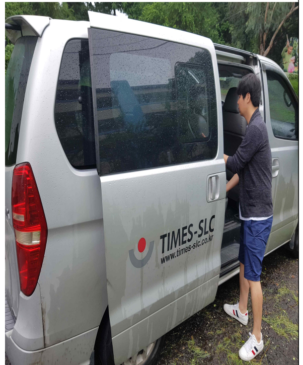
중요 행사시 이용가능한 SLC차량