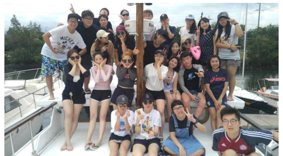
대만 학생들을 포함한 단체사진