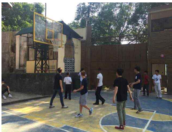
고아원으로 봉사를 가서 농구를 하는 사진