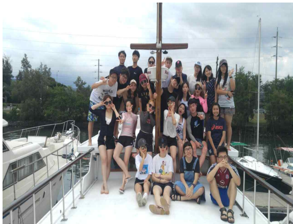
요트여행 가서 찍은 사진