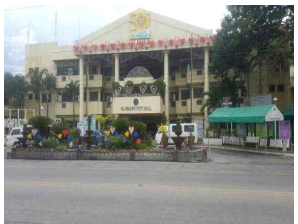
방문한 지역 시청 사진