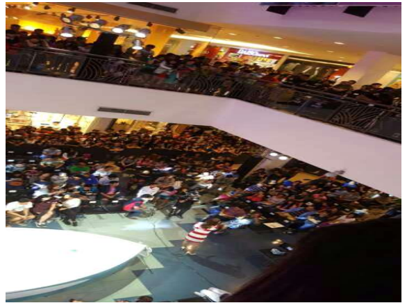
백화점에서 현지 가수가 노래부르는 사진