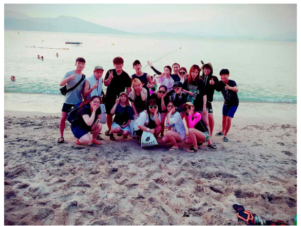
까마얀 비치에 가서 찍은 사진