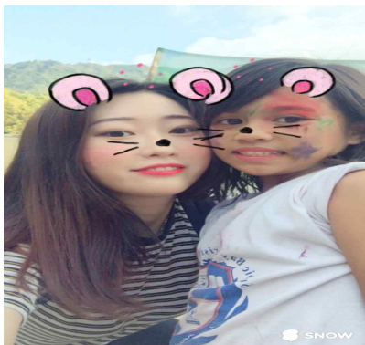
outeach program 봉사활동