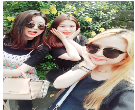
fort santigo park