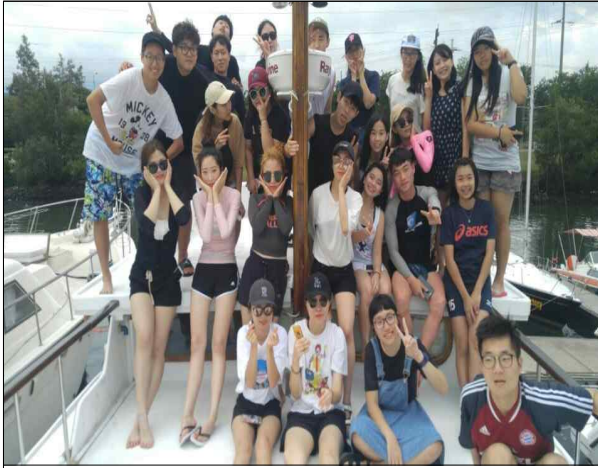
요트투어 대만학생들과 순천항팀