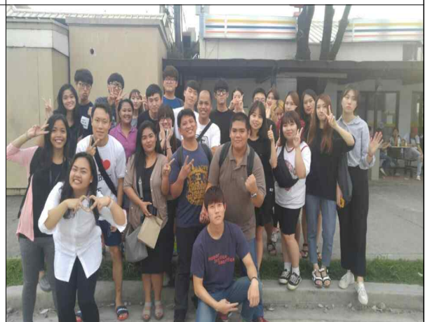
귀국전 선생님들과 저녁식사