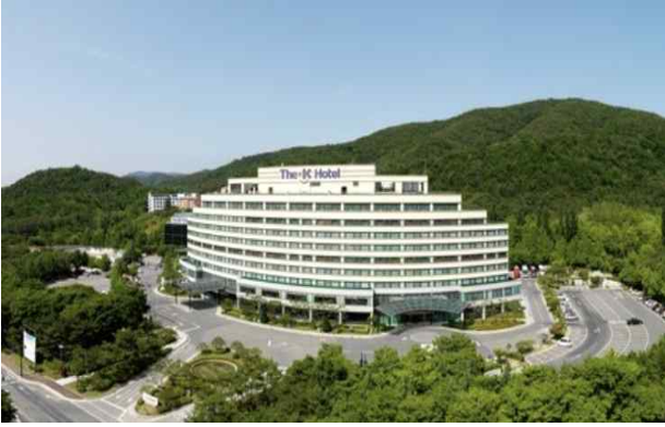
경주 더케이호텔 전경