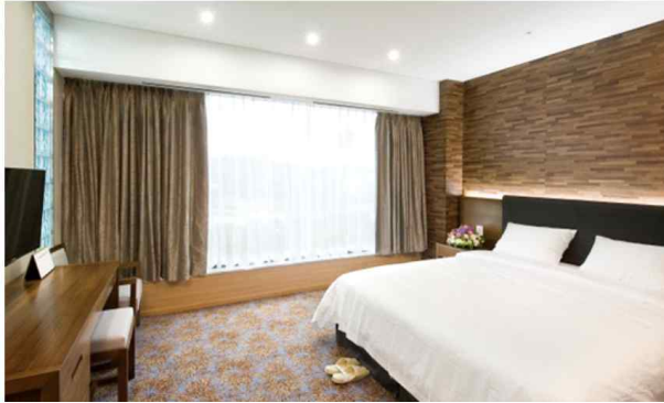
경주 더케이호텔 룸