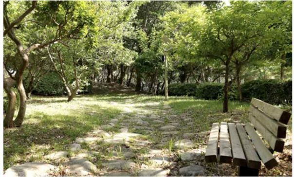
경주 더케이호텔 산책로