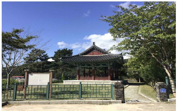
경주 이건대 (조별 발표 장소)