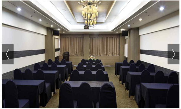
경주 더케이호텔 회의실