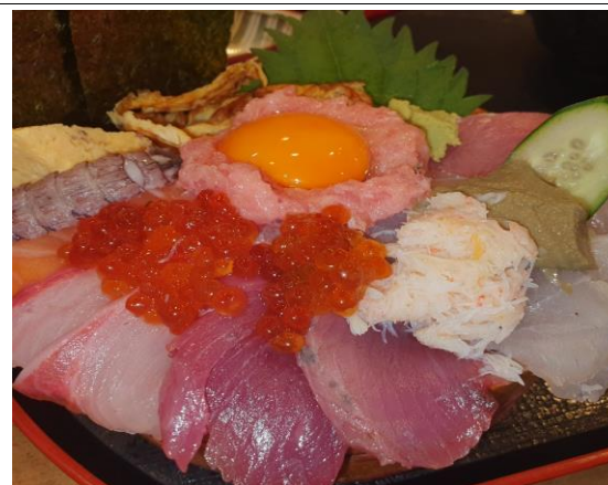
학교 근처 카이센동 집