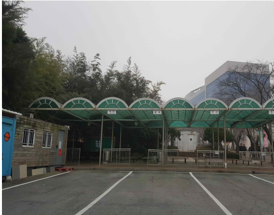
[후문 통학버스 승강장]