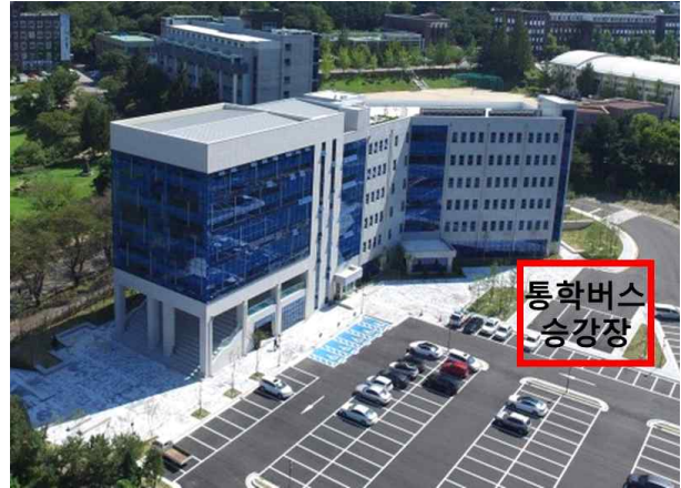
[미디어랩스관 뒤 통학버스 승강장]