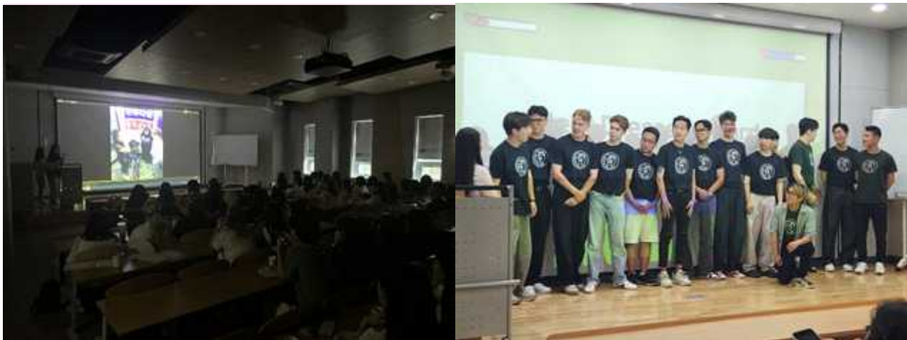
2023-1 G.V. FAREWELL PARTY